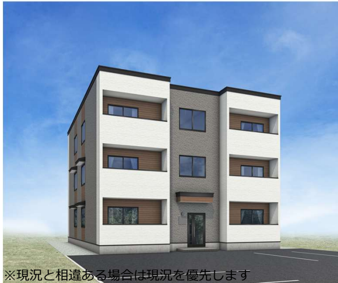
※現況と相違ある場合は現況を優先します