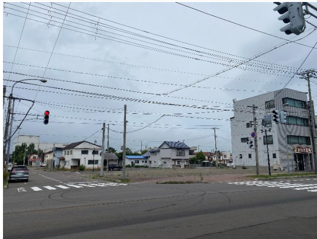
役場・銀行・飲食店街にも近い市街地、以前は食品市場があり、現在空地。